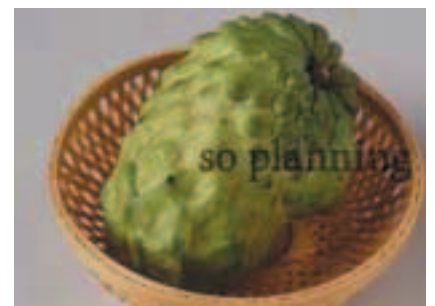
カスタードアップル B-H002C