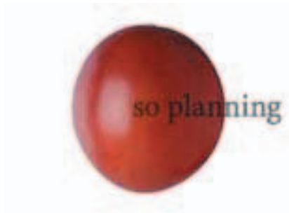
パッションフルーツ B-H005A