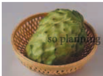
カスタードアップル B-H002B