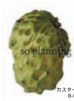
カスタードアップル B-H002A