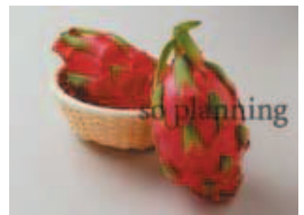
レッドピタヤ (ドラゴンフルーツ) B-H017A