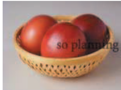
パッションフルーツ B-H005B