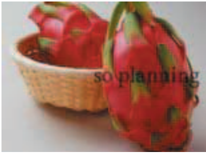
レッドピタヤ (ドラゴンフルーツ) B-H017C