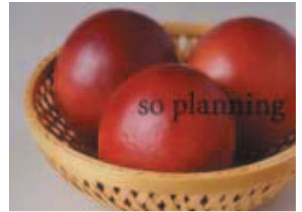
パッションフルーツ B-H005C