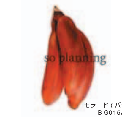
モロード (バナナ) B-G015A