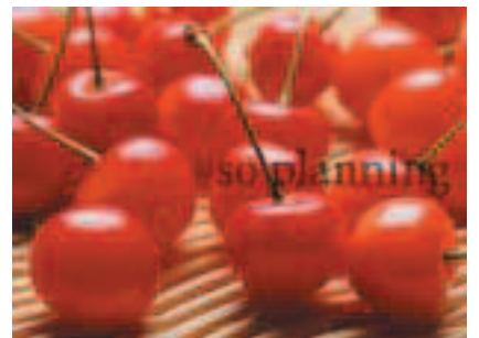
さくらんぼ (佐藤錦) B-G010C