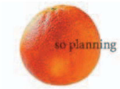
ブラッドオレンジ B-B025A