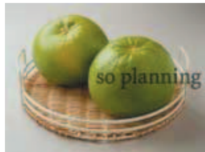
スウィーティ (オロブランコ) B-B019B