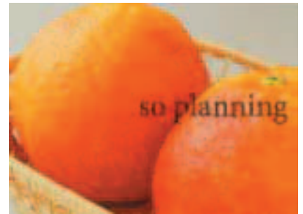
ブラッドオレンジ B-B025C