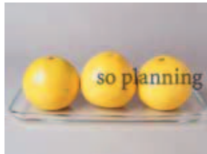
グレープフルーツ B-B006B