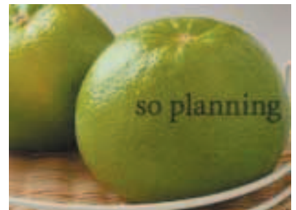
スウィーティ (オロブランコ) B-B019C