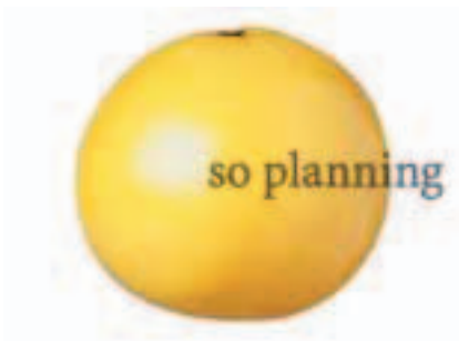
グレープフルーツ B-B006A