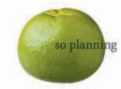
スウィーティ (オロブランコ) B-B019A