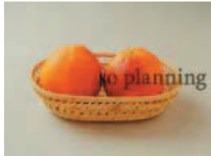
ブラッドオレンジ B-B025B