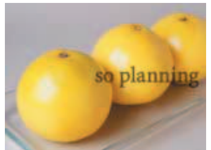
グレープフルーツ B-B006C