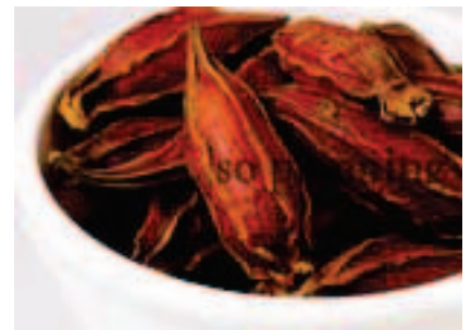
ゆりの花 / つぼみ E-K017C