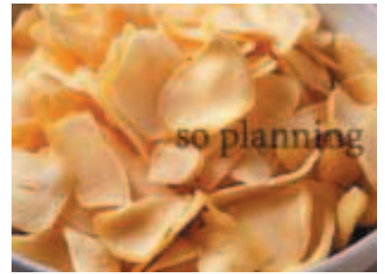
にんにく / スライス E-K016C