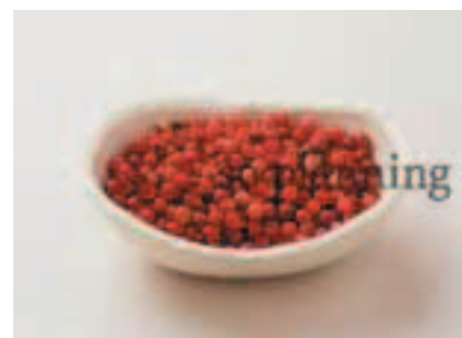
赤こしょう / 粒 E-K007B