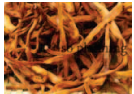
ゆりの花 / 花びら E-K018C