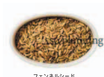
フェンネルシード E-K008A