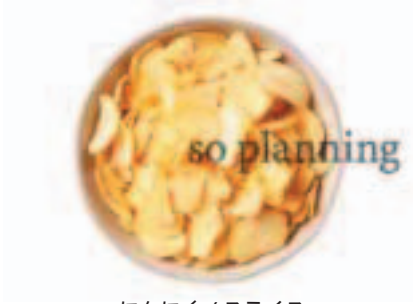
にんにく / スライス E-K016A