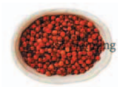
赤こしょう / 粒 E-K007A