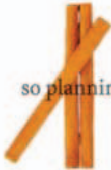
シナモンスティック E-K015A