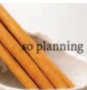
シナモンスティック E-K015C