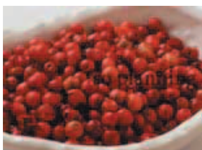
赤こしょう / 粒 E-K007C