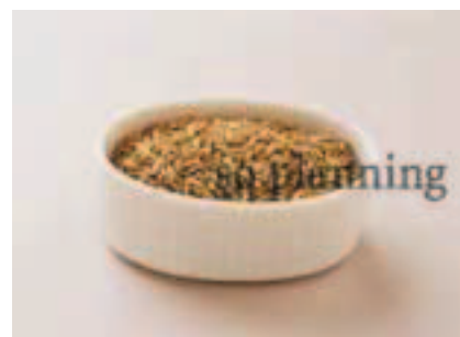
フェンネルシード E-K008B