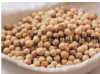
白こしょう / 粒 E-K002C