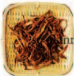
ゆりの花 / 花びら E-K018A