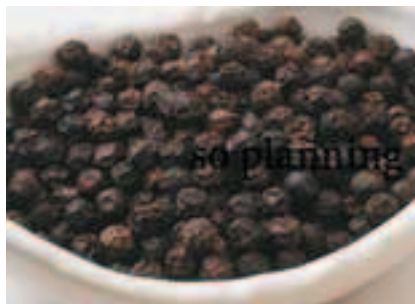
黒こしょう / 粒 E-K001C