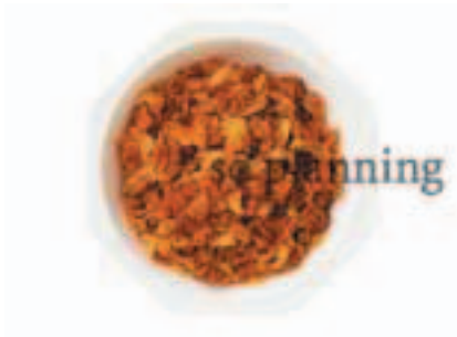
赤ねぎ / スライス E-K019A