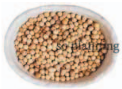
白こしょう / 粒 E-K002A