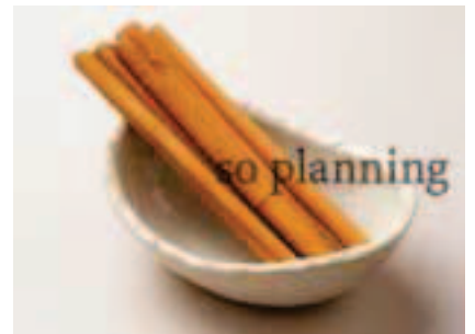
シナモンスティック E-K015B