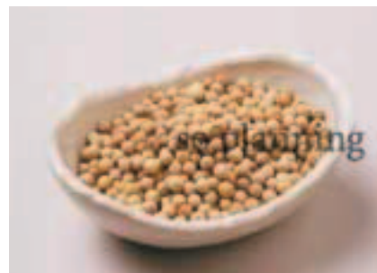
白こしょう / 粒 E-K002B