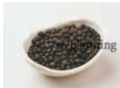
黒こしょう / 粒 E-K001B