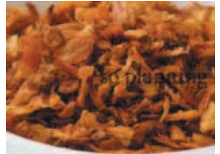
赤ねぎ / スライス E-K019C