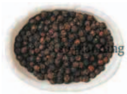
黒こしょう / 粒 E-K001A