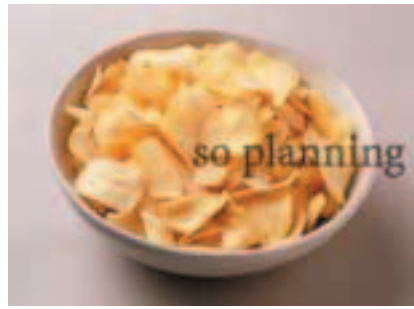
にんにく / スライス E-K016B