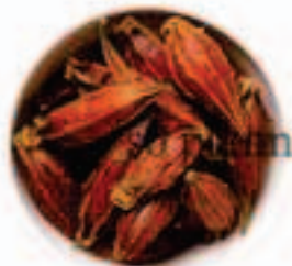
ゆりの花 / つぼみ E-K017A