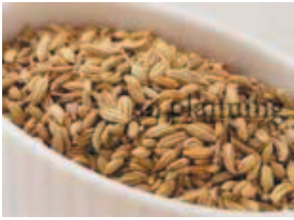
フェンネルシード E-K008C