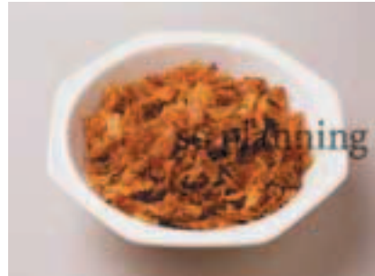
赤ねぎ / スライス E-K019B