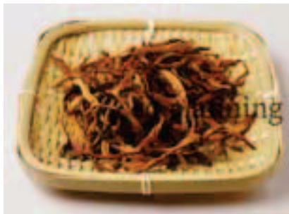
ゆりの花 / 花びら E-K018B