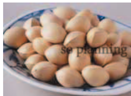
ぎんなん / 殻付き E-J018C