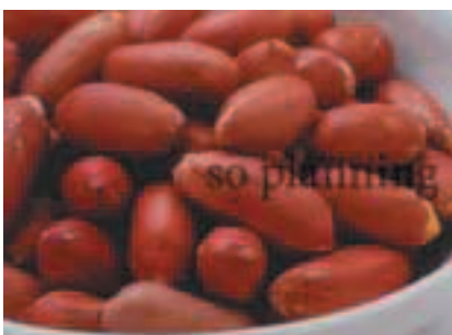
ピーナッツ / 皮つき E-J010C