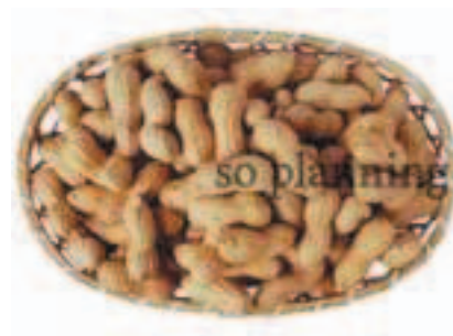
ピーナッツ / 殻付き E-J016A