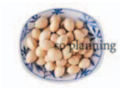
ぎんなん / 殻付き E-J018A