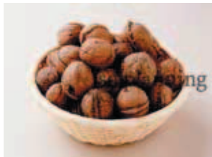
くるみ / 殻付き E-J017B