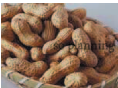
ピーナッツ / 殻付き E-J016C