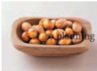
ぎんなん / 皮付き E-J020B