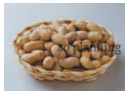
ピーナッツ / 殻付き E-J016B