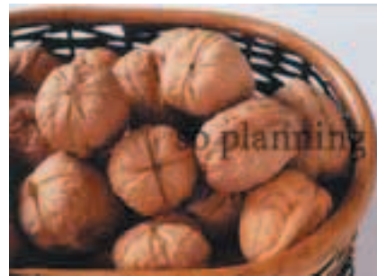
くるみ / 殻付き E-J017C