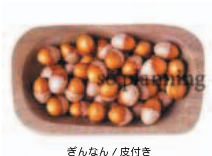
ぎんなん / 皮付き E-J020A