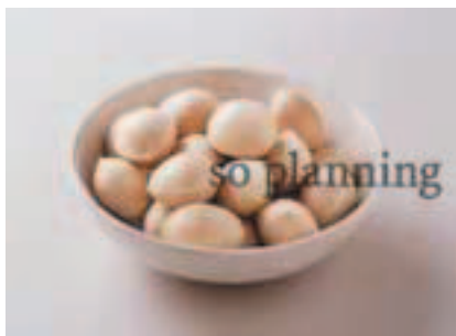
ぎんなん / 殻付き E-J018B