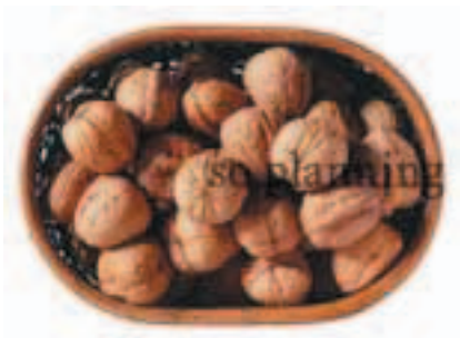
くるみ / 殻付き E-J017A