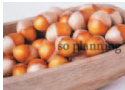
ぎんなん / 皮付き E-J020C