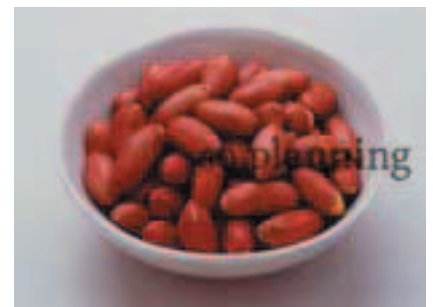
ピーナッツ / 皮つき E-J010B