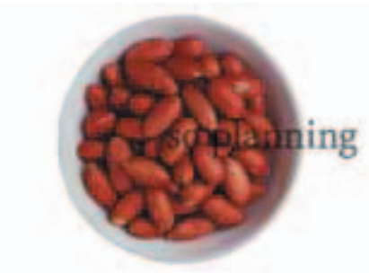
ピーナッツ / 皮つき E-J010A