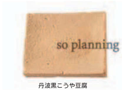
丹波黒こうや豆腐 E-H018A