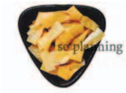
京湯葉 / 結び湯葉 E-H017A