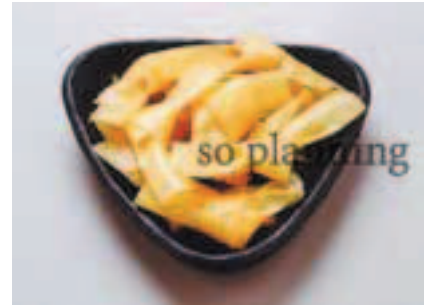
京湯葉 / 結び湯葉 E-H017B