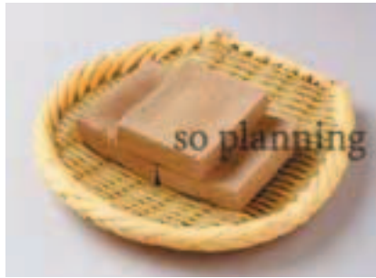
丹波黒こうや豆腐 E-H018B