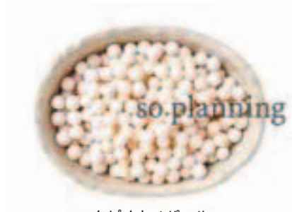
タピオカノパール E-H031A