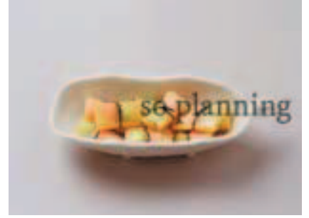
乙女椿 / 湯葉 E-H027B