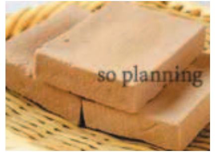
丹波黒こうや豆腐 E-H018C