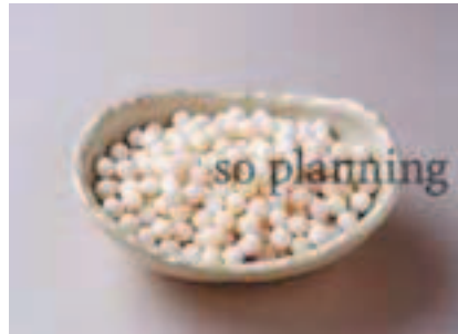
タピオカノパール E-H031B