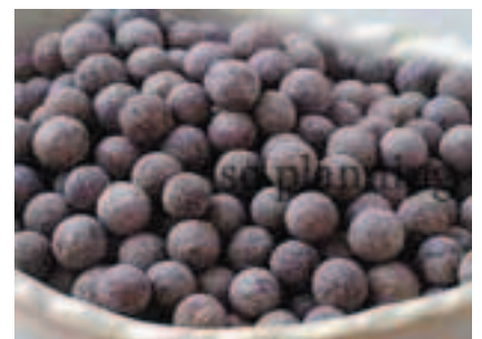
ブラックタピオカノパール E-H032C