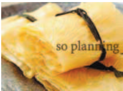
大原木湯葉 / 京湯葉 E-H057C