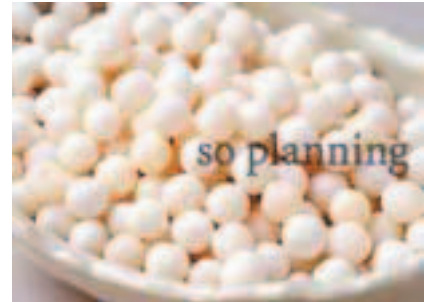
タピオカノパール E-H031C