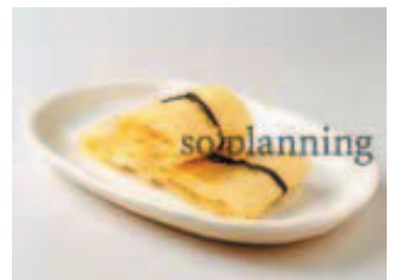
大原木湯葉 / 京湯葉 E-H057B