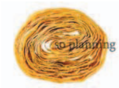
京湯葉 / よせ巻き湯葉 E-H014A