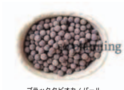
ブラックタピオカノパール E-H032A