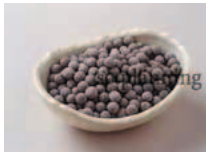
ブラックタピオカノパール E-H032B