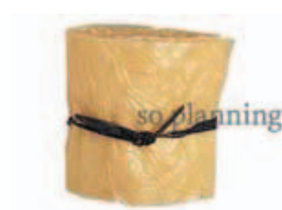
大原木湯葉 / 京湯葉 E-H057A