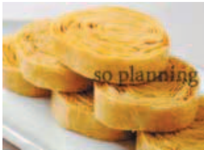
京湯葉 / よせ巻き湯葉 E-H014C