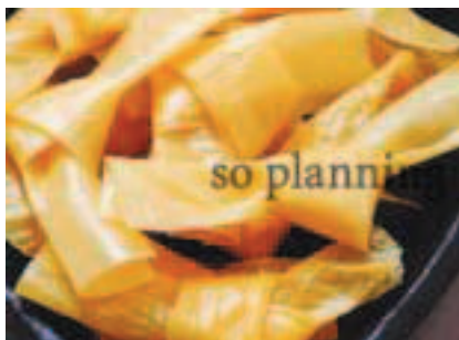
京湯葉 / 結び湯葉 E-H017C