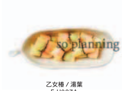
乙女椿 / 湯葉 E-H027A