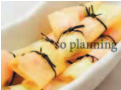
乙女椿 / 湯葉 E-H027C