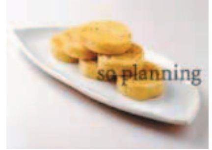
京湯葉 / よせ巻き湯葉 E-H014B