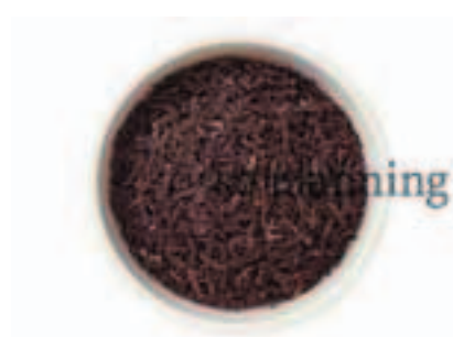
紅茶 (アッサム) E-M008A