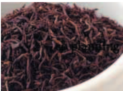
紅茶 (アッサム) E-M008C