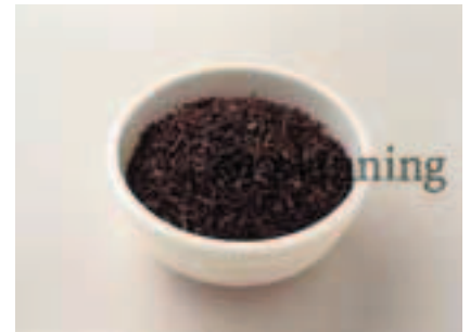
紅茶 (アッサム) E-M008B