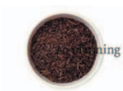
紅茶 (ダージリン) E-M007A