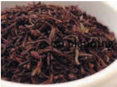
紅茶 (ダージリン) E-M007C