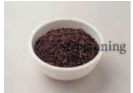
紅茶 (ダージリン) E-M007B